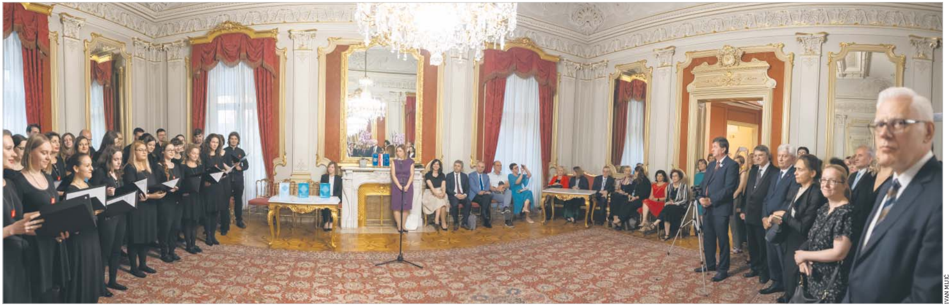
Posiedzenie Wspólnego Komitetu Ministrów CEEPUS (Meeting of the Joint Committee of CEEPUS Ministers), Zagrzeb 2019